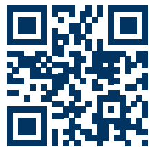
Nähere Infos unter gvh.de

Telefon: 0511 590-9000 Mo.–Fr. 06:00–23:00 Uhr, Sa. 06:00–20:00 Uhr, So. 07:00–20:00 Uhr